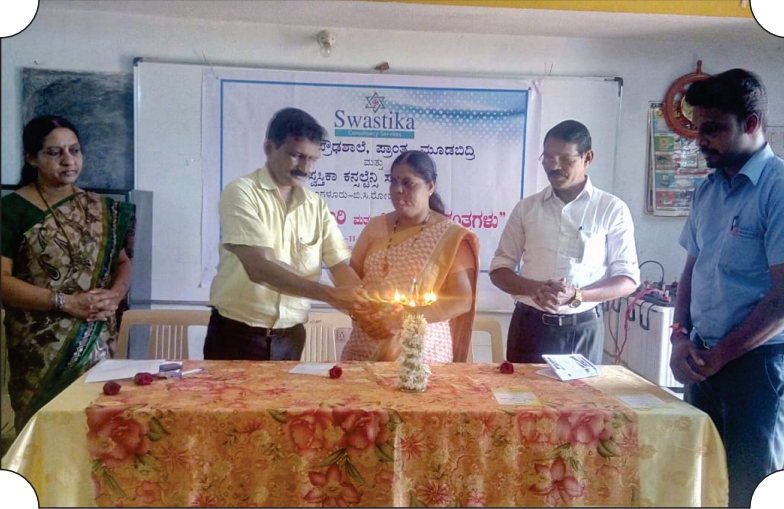
ಸರ್ಕಾರಿ ಪ್ರೌಢಶಾಲೆ ಪ್ರಾಂತ್ಯ, ಮೂಡಬಿದ್ರಿ