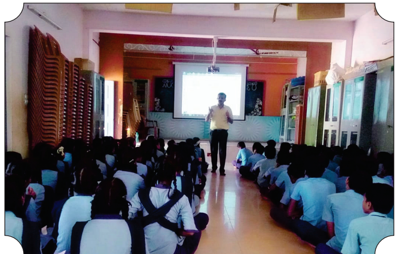
ಸರ್ಕಾರಿ ಸಂಯುಕ್ತ ಪ್ರೌಢಶಾಲೆ, ನೀರ್ಕೆರೆ, ಮೂಡಬಿದ್ರಿ