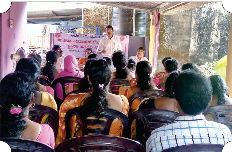
ಆದರ್ಶ (ರಿ.), ಮೂಡಬಿದ್ರಿ ನವಚೇತನ ವಿವಿಧೋದ್ದೇಶ ಸೌಹಾರ್ದ ಸಹಕಾರಿ ನಿಯಮಿತ