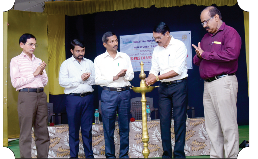
ಶ್ರೀ ಮಹಾವೀರ ಕಾಲೇಜು ಮೂಡಬಿದ್ರಿ